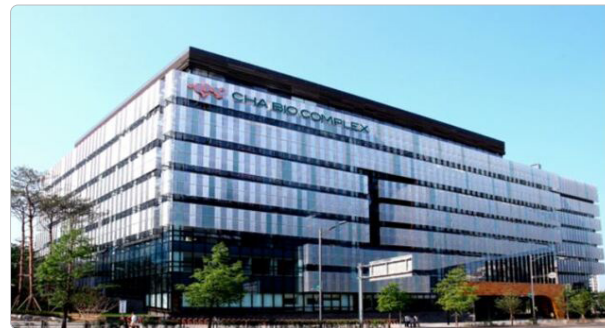
주소: 경기도 성남시 분당구 판교로 335